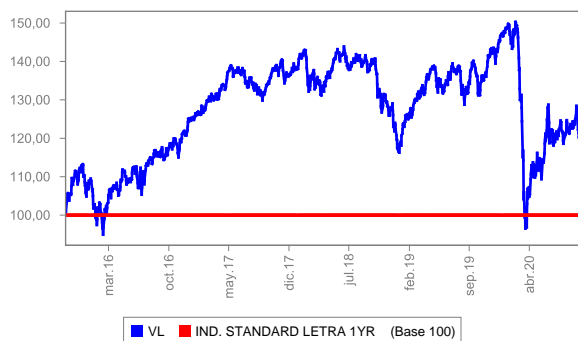
Evolución del valor liquidativo últimos 5 años