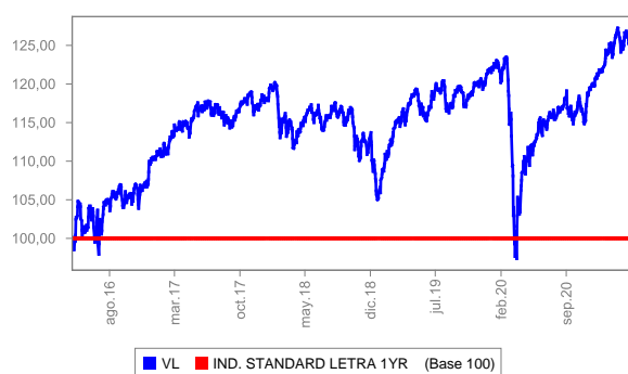
Evolución del valor liquidativo últimos 5 años