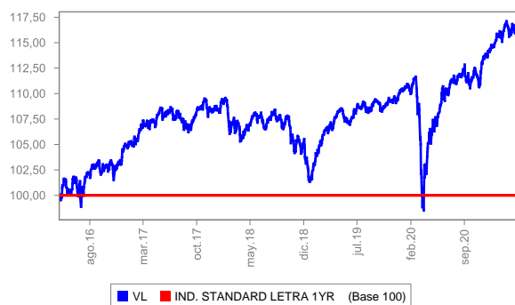
Evolución del valor liquidativo últimos 5 años