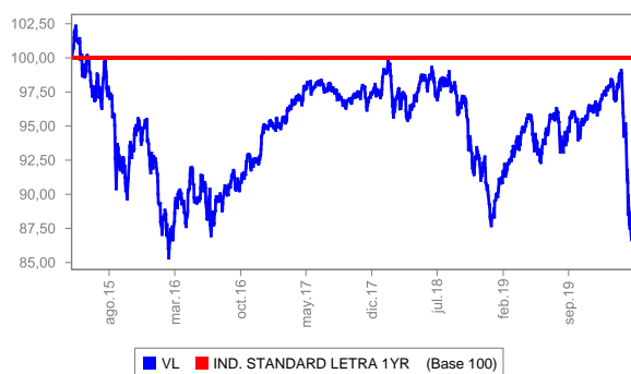
Evolución del valor liquidativo últimos 5 años