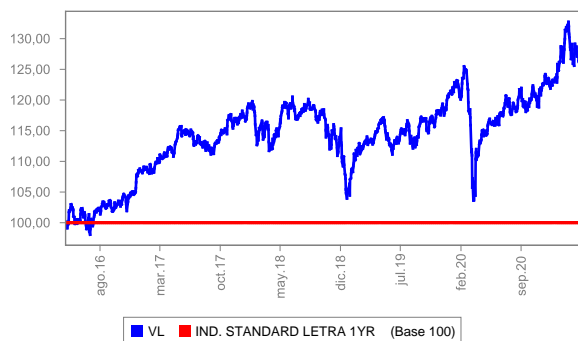
Evolución del valor liquidativo últimos 5 años