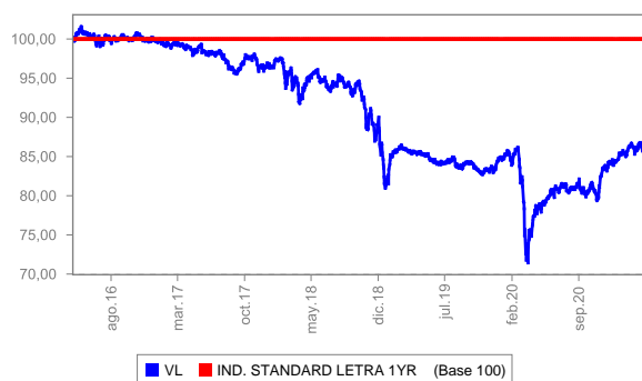
Evolución del valor liquidativo últimos 5 años