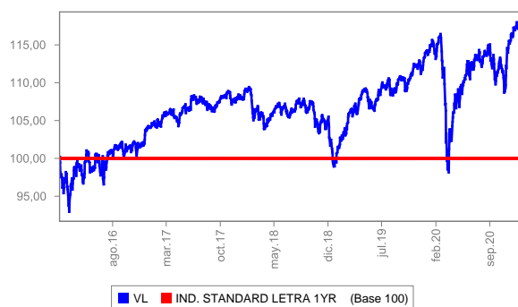
Evolución del valor liquidativo últimos 5 años