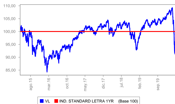
Evolución del valor liquidativo últimos 5 años