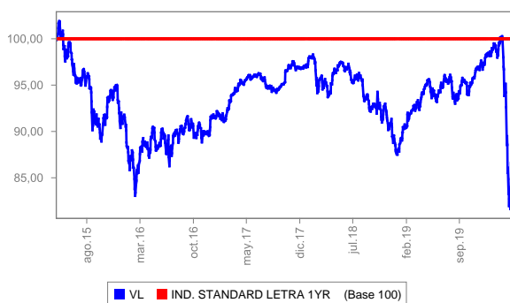
Evolución del valor liquidativo últimos 5 años