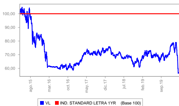
Evolución del valor liquidativo últimos 5 años