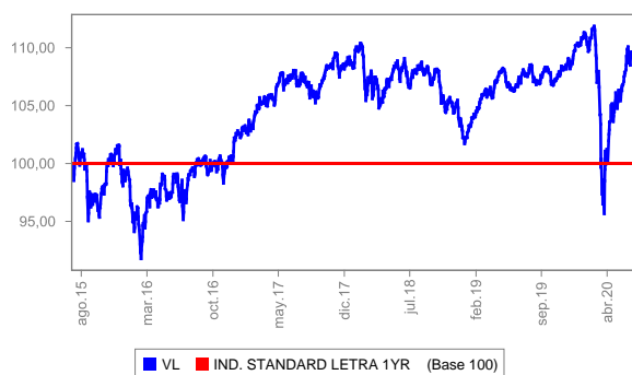
Evolución del valor liquidativo últimos 5 años