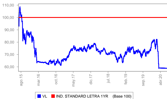
Evolución del valor liquidativo últimos 5 años